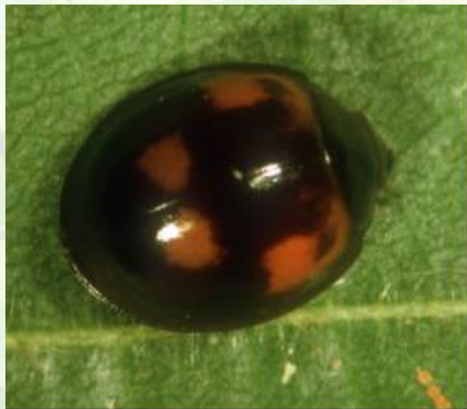
La coccinelle Exochomus quadripustulatus Stade adulte