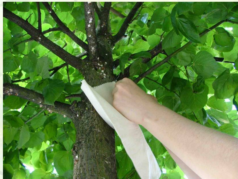
Introduction de larves de coccinelles dans les arbres