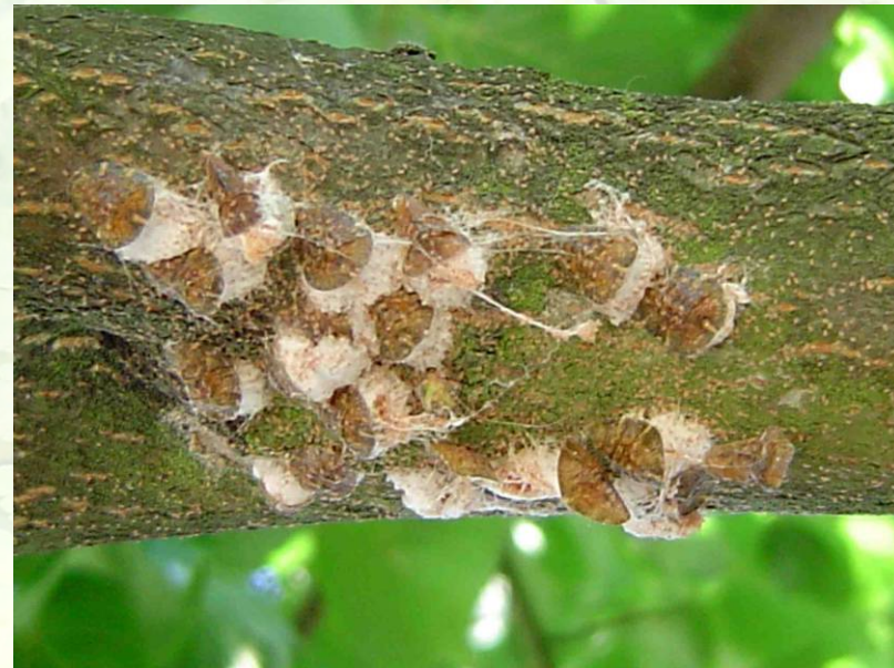
Ovisacs de la cochenille pulvinaire Pulvinaria regalis sur charpentières